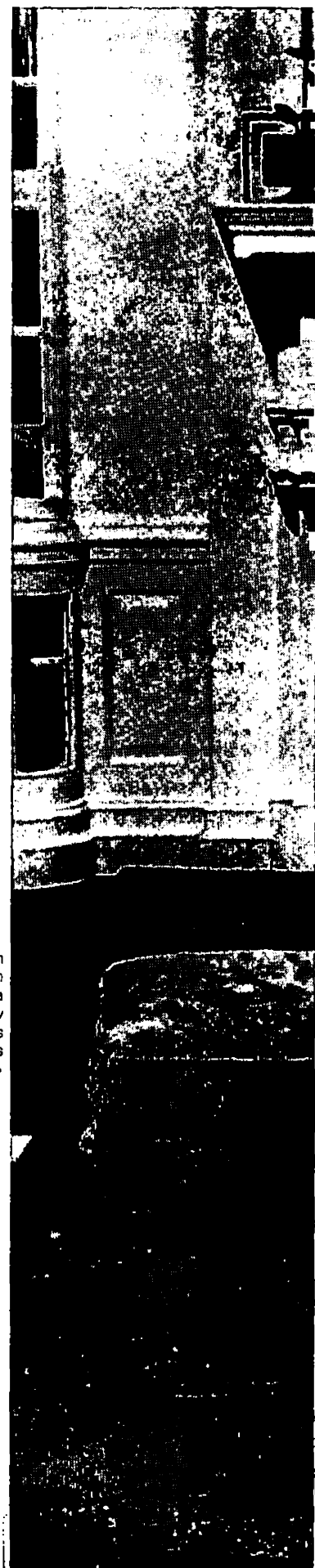
Ruth Gordon et Mia Farrow dans « Rosemary's Baby ».

Polanski Mais Mister Magoo est un personnage réaliste. C'est la transcription dans le cartoon, à travers une vision de créateur, d'un certain type d'Américain qui existe bel et bien et que vous pouvez rencontrer dans le hall d'un Hilton ou sur un aéroport en train de s'assoupir en attendant sa femme. Mr Castevet en est lui aussi un bon représentant. Et cela me rend assez heureux que (suite page 62)